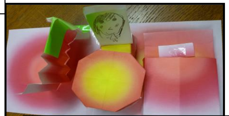
「こんな自分の部屋だったら、いいな♪」の理想の自分の部屋