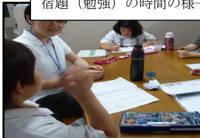
宿題（勉強）の時間の様子