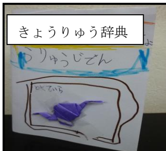
きょうりゅう辞典