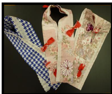
①クールマフラー完成