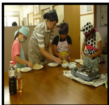
③クッキングの様子