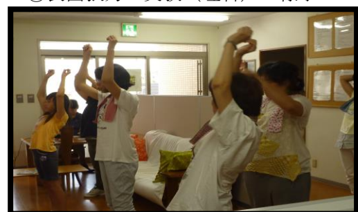
⑥午後のラジオ体操の様子