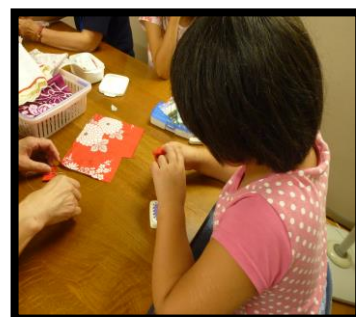
②裁縫時の様子（布地にリボンやレースをつけています。）