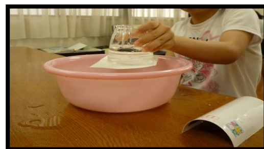
⑤表面張力の実験（理科）の様子

クッキングでは、ポテトサラダ、わかめときゅうりの酢の物、もやしの和え物（カレー風）、プリン、白玉かき氷、水ようかんを作っています。火や包丁を使用するため、みんなで注意することを考え、話し合った上で参加し、後片付けまで協力して取り組まれています。