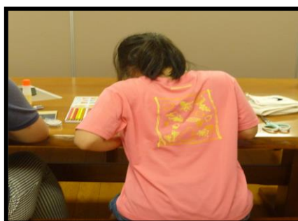
②プログラム時の様子