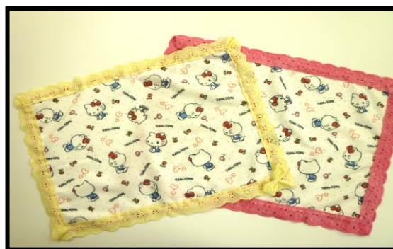
①創作活動（裁縫・ランチョンマットづくり）