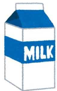
① 牛乳パックとつまようじでコマづくり