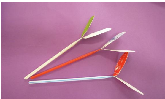
② ストローと牛乳パックでたけとんぼづくり